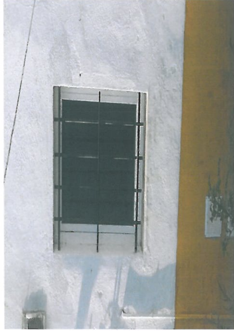
MODIFICAR LAS VENTANAS EXTERIORES PARA APORTAR A LOS ALOJAMIENTOS LUZ NATURAL Y VENTILACION.