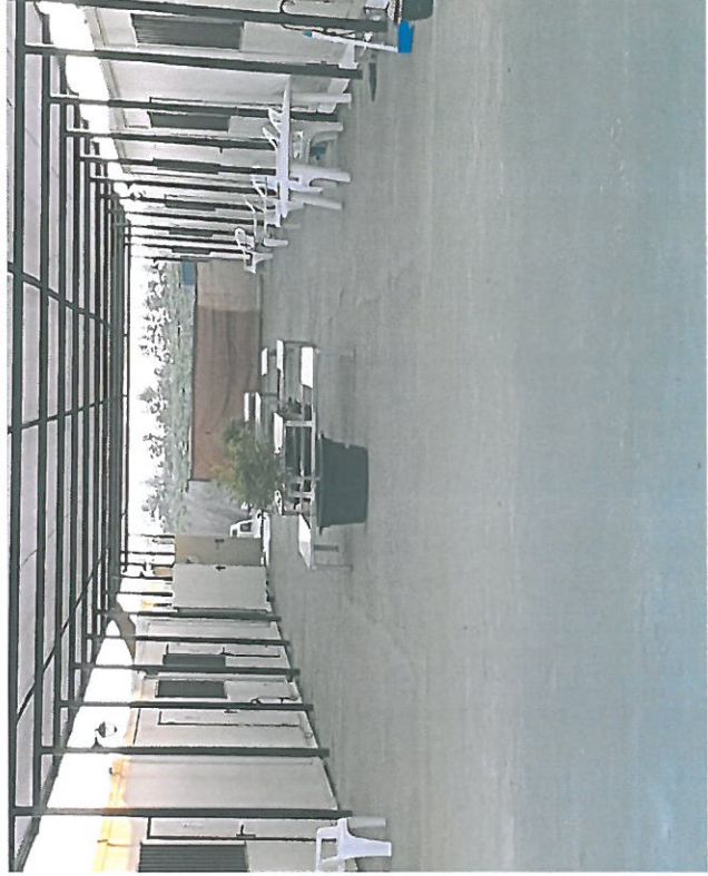
PINTADO Y AJARDINADO DEL PASILLO DE ACCESO A LA ZONA DE ALOJAMIENTOS. COLOCACION DE MESAS Y SILLAS COMO ZONA DE DESCANSO Y REUNION COMUN DE LOS ALOJADOS.