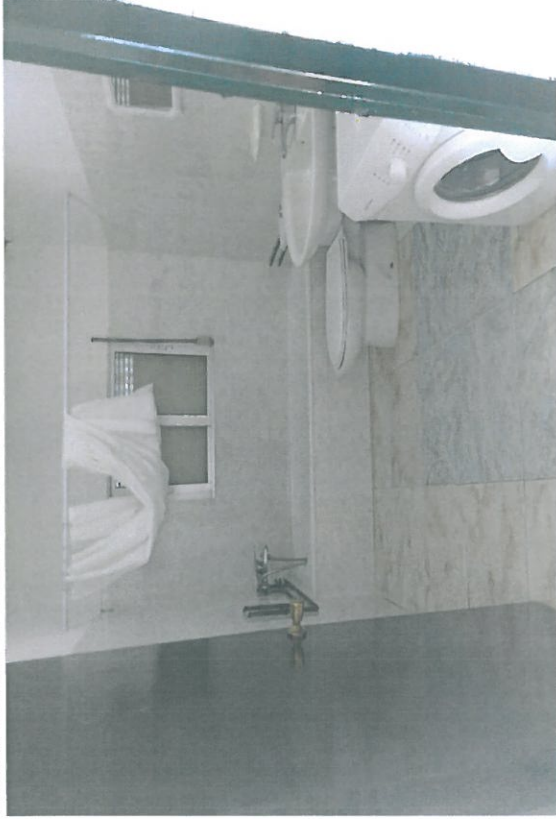
MEJORA EN LOS ASEOS.