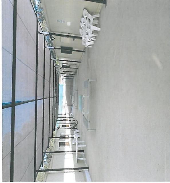
CONSTRUCCION DE ZONA AISLADA COMUN DE TENDEDEROS Y CONSTRUCCION DE ALPENDE EN EL ESPACIO COMUN QUE COMUNICA LOS ALOJAMIENTOS. COLOCACION DE MESAS – SILLAS CREANDO UNA ZONA DE REUNION Y DE DESCANSO