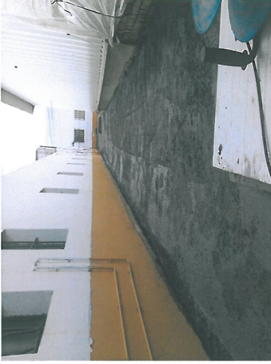
MEJORA DE LOS ALREDEDORES, PARA ELIMINAR POSIBLES HUMEDADES EN LOS LOJAMIENTOS.