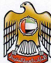
United Arab Emirates